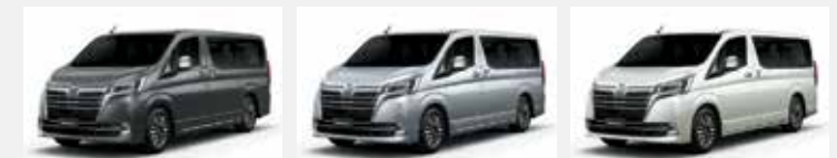
معدني رمادي (IG3)